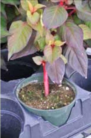
Photo11: Embranchement inférieur insuffisant des plants suite à un repiquage trop tardif des plantules, cultivar 'Chinatown'.

La coloration plus rougeâtre du feuillage du cultivar 'Chinatown' comparativement au cultivar 'Fresh Look Red' ne nous est pas apparue intéressante. Sous serre, cette coloration est moins intense qu'à l'extérieur. La teinte verte du cultivar 'Fresh Look Red' permet mieux de mettre les fleurs plus en valeur.