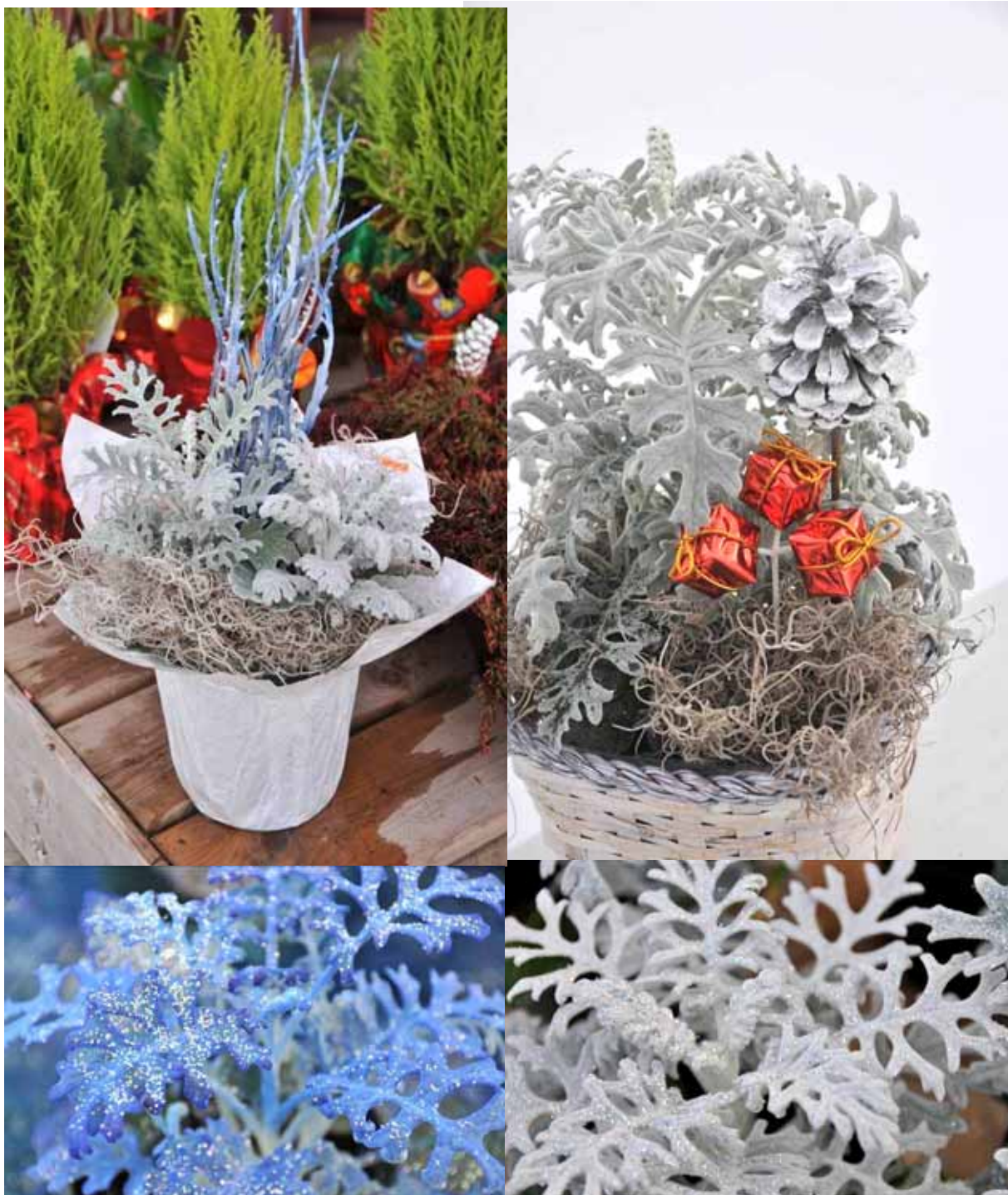
Photo 24 : Senecio cineraria 'Silver Dust'. Traitement à la colle/brillants/colorant (en bas à gauche) et traitement à la colle/brillants (en bas à droite).