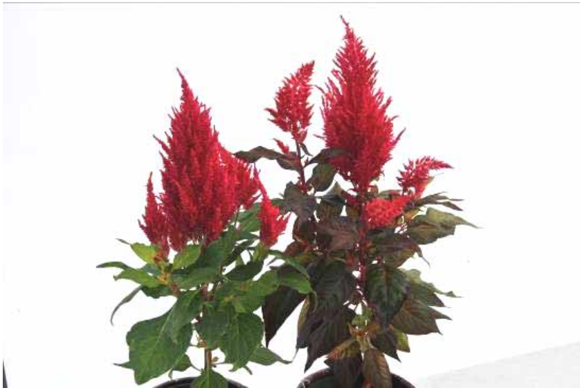
Photo 12 : Cultivar 'Fresh Look Red' (gauche) et cultivar 'Chinatown' (droite)

Nous avons également observé que la structure des plants du cultivar 'Fresh Look Red', plus conique, était plus appropriée pour la potée fleurie que celle du cultivar 'Chinatown'.