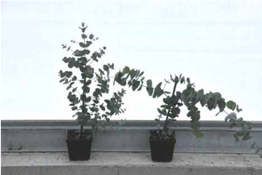
Photo 19 : Eucalyptus 'Silver Drops' (gauche), mieux structuré et 'Silver Dollard' (droite)

Le manque d'uniformité de croissance des semis démarrés n'a pas permis la réalisation d'essai de régulateurs de croissance. Les plants produits avaient un aspect filiforme, et ce, avec un embranchement insuffisant. Le cultivar 'Silver Drops' a une structure (embranchement) beaucoup plus régulière que le cultivar 'Silver Dollard' (photo 19). Les feuilles des deux cultivars ont souffert d'œdème et le feuillage a été déformé suite à un début d'apparition de pucerons.