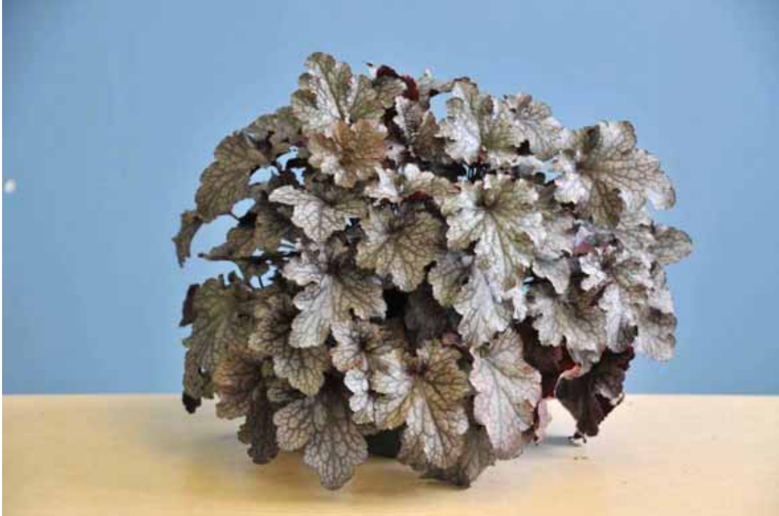
Photo 22 : plant d'heuchère 'Plum Puding' après 43 jours à l'intérieur.