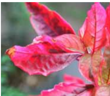
2e semaine à l'intérieur

Comme plante d'intérieur, cette potée commence à se dégrader deux semaines suite à la sortie des serres.