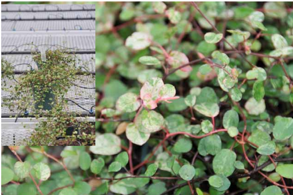
Photo 23 : Muehlenbeckia axillaris (gauche) et Muehlenbeckia axillaris Tricolor (droite)