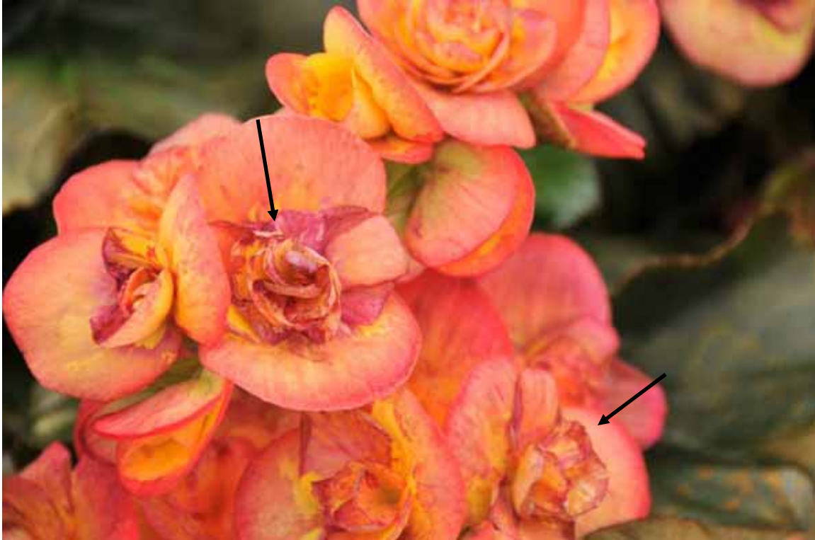
Photo 7: Vieillesse prématurée des pétales de bégonia 2 semaines suivant le traitement de coloration (utilisation de la couleur Fuchsia sur fleur orangée).

Il est à noter que la présence de colorant sur le feuillage n'a pas occasionné de dommages immédiats. Les symptômes ont pris environ deux semaines à se manifester sous forme de plages nécrotiques ternes sur le feuillage. Ces symptômes étaient suffisants pour déclasser les plants.