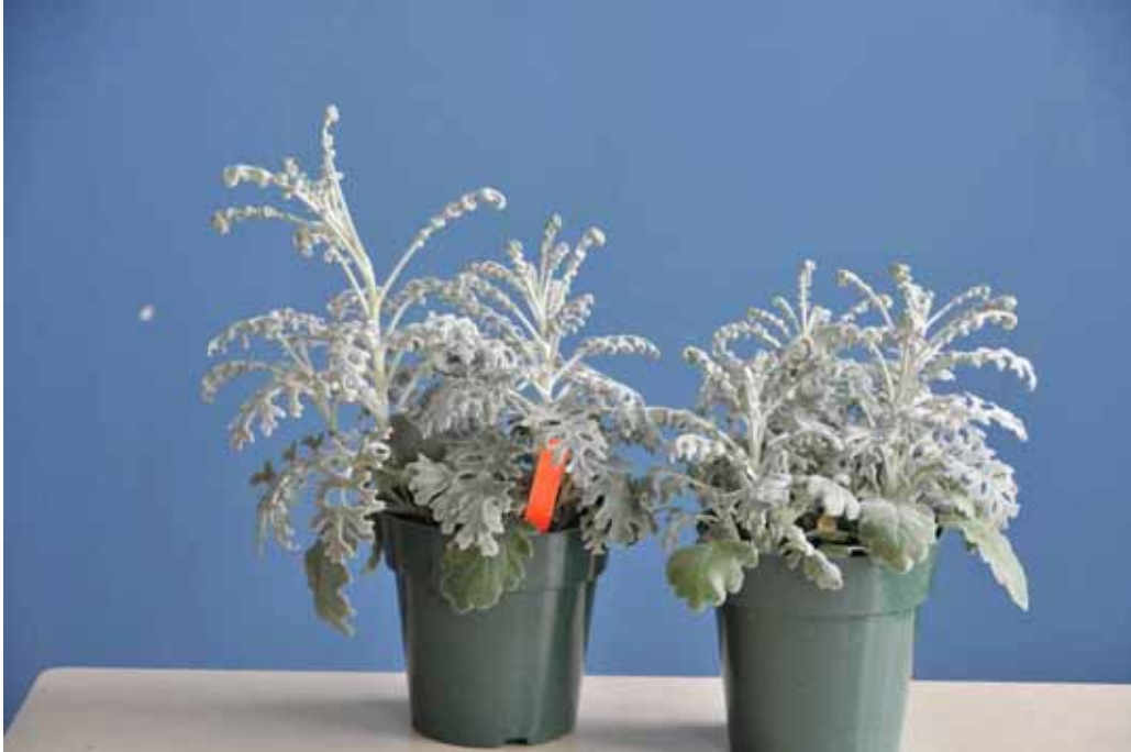
Photo 25 : Cinéaire maritime après cinq semaines sous conditions postproduction. Plant de droite traité au B-Nine et plant de gauche non traité.