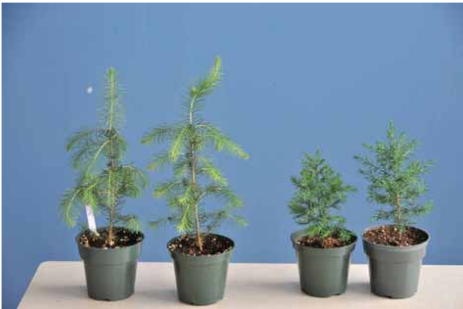
Photo 17 : aspect des plantes 43 jours après la sortie des serres. Picea omorika (gauche) et Juniperus virginiana (droite).