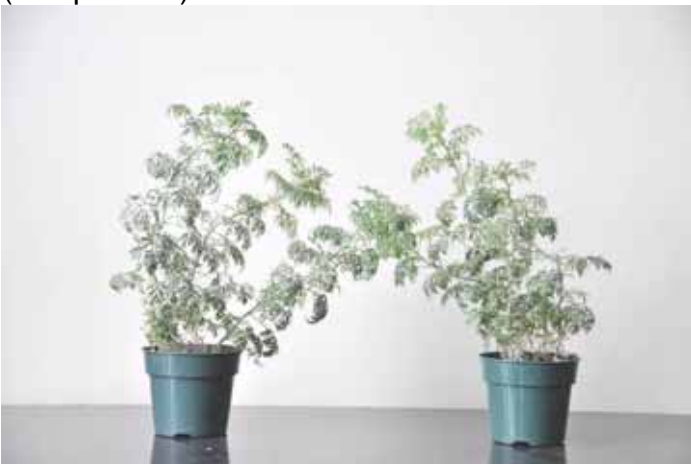
Photo 3 : Étiollement des potées (4 po.) après un mois à l'intérieur.

Cette plante demande beaucoup de lumière afin de conserver son port compact chez le consommateur. Des essais de régulateurs de croissance seraient à effectuer afin de contrôler l'étiollement des tiges en conditions de postproduction (voir photo 3).