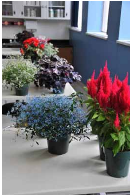
Photo 1 : Essais de conservation après-vente. Salle sud-ouest à gauche et salle nord-ouest à droite.

Quatre plants de chaque espèce ont été placés dans chacune des classes. L'essai s'est déroulé du 22 décembre au 3 février, soit sur une période de 43 jours.