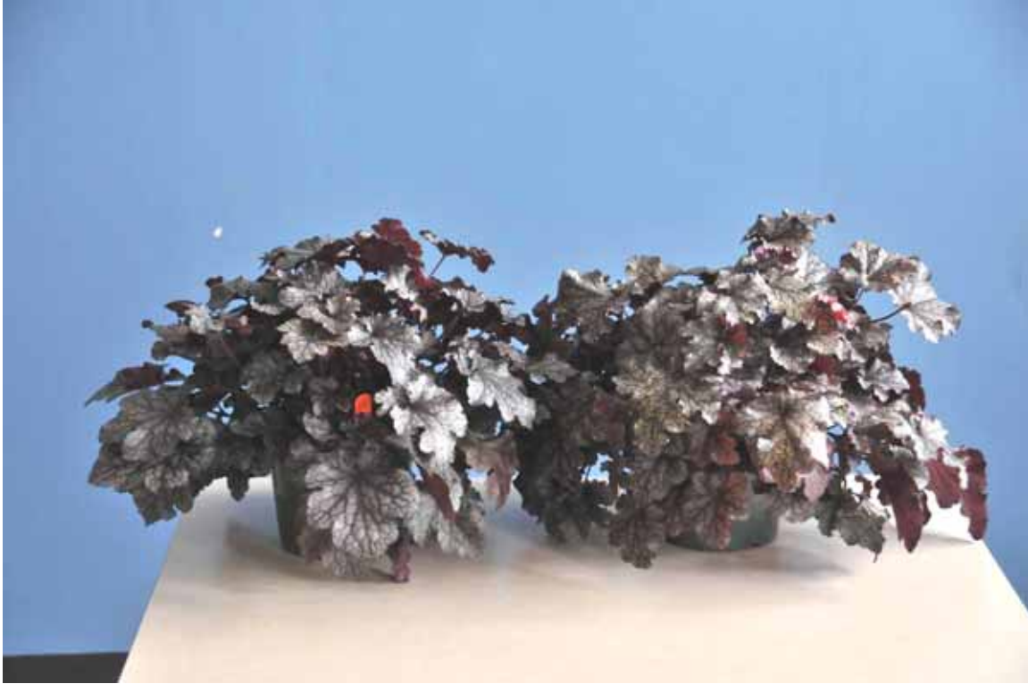
Photo 21 : Heuchere 'Plum Pudding', après cinq semaines sous conditions postproduction. Plant de droite traité au Bonzi et plant de gauche non traité (aucune différence).

Les plants traités à la colle, au colorant et à ces deux traitements simultanés observent une aussi bonne conservation après vente que les plants non traités. L'application de Bonzi n'a pas influencé la croissance des plants en conditions postproduction.