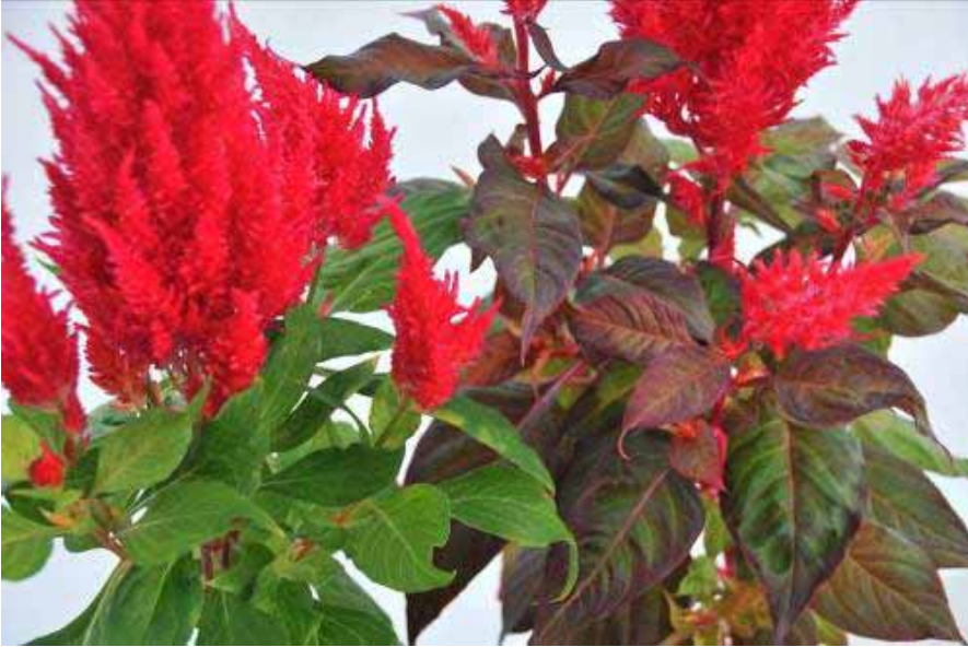
Photo 10: Celosie 'Fresh Look Red' (à gauche) et célosie 'Chinatown' (à droite).