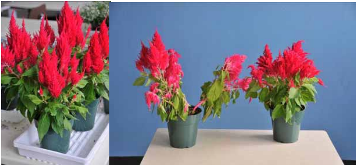
A B Photo 14 : Célosia 'Fresh Look Red' sous conditions postproduction au 7 janvier (A) et au 22 janvier (B) (soit environ 2 et 4,5 semaines après la sortie des serres).

Les essais de conservation après-vente ont démontré que cette plante avait une durée de vie d'environ trois à quatre semaines chez les consommateurs. Comparativement à d'autres végétaux d'intérieur, la célosie consomme beaucoup d'eau. Certains plants ont atteint le point de flétrissement à quelque reprise en cours d'expérimentation alors que les autres végétaux ne manquaient pas d'eau. Suite à ce stress, les célosies reprennent leur turgescence après une irrigation, mais ont tendance à conserver un port plus ouvert. Ce stress semble également affecter la durée de vie du produit. Le grand besoin en eau de cette espèce peut devenir un irritant majeur pour le maintien de la qualité des plants sur le site de vente et pour le consommateur.