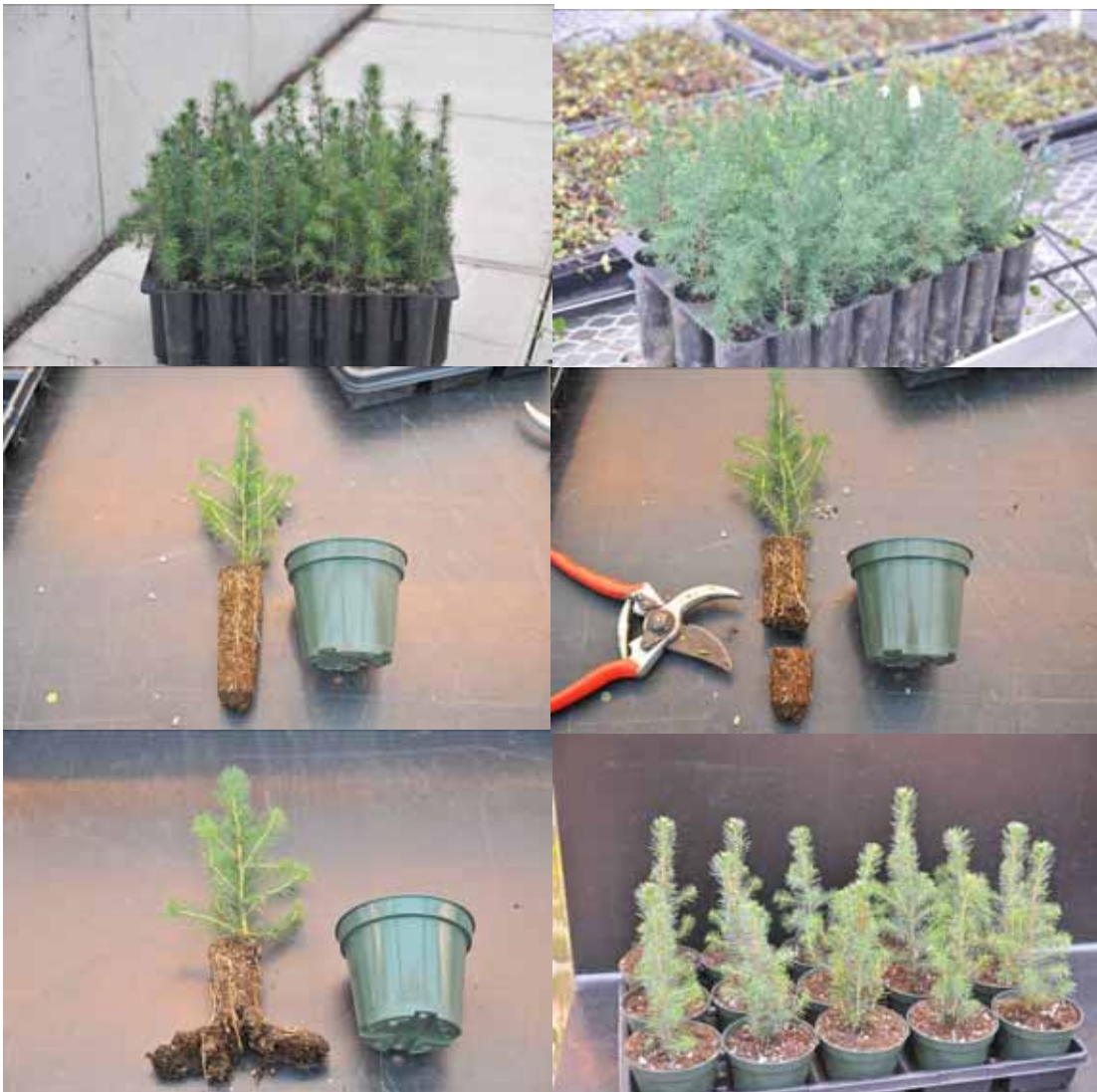
Photo 16 : Deux techniques de taille des racines afin de permettre l'empotage en pot de 10 cm. du plant en cellules.